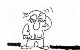
Tabella 1: Struttura e aspettative per il dossier di riflessione